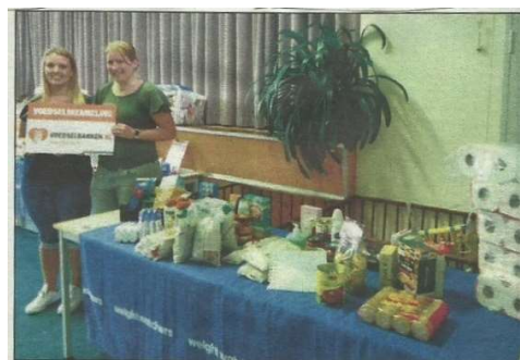
De verzamelde spullen werden overhandigd aan de Voedselbank.

Een bijzondere en vermeldenswaardige actie was die van de Weight Watchers. In een bepaalde periode werden de grammen die de deelnemers kwijt raakten vertaald in producten voor onze Voedselbank. In totaal werd door de deelnemers 30.000 gram gewicht verloren waardoor we een mooie hoeveelheid van 30 kg. voedsel in ontvangst mochten nemen.